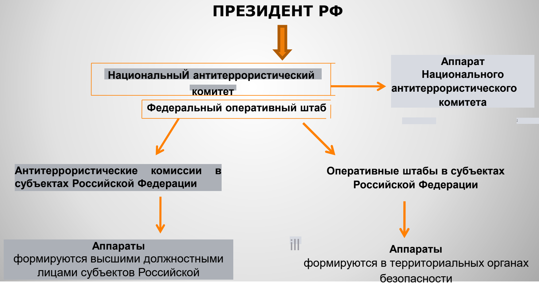
СХЕМА КООРДИНАЦИИ ДЕЯТЕЛЬНОСТИ ПО ПРОТИВОДЕЙСТВИЮ ТЕРРОРИЗМУ В РОССИЙСКОЙ ФЕДЕРАЦИИ